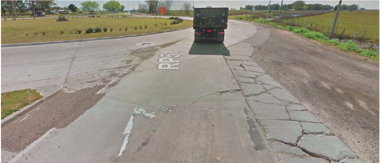
Imagen 3. Deterioro en la Intersección de la R.P. N°51 y R.P. N° 61 Partido de Gral. Alvear