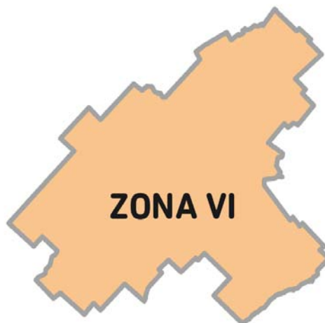
Imagen 2. La Zona VI está conformada por los Partidos: 25 de Mayo, General Alvear; General Las Heras, Las Flores, Lobos, Navarro, Roque Pérez, Saladillo.