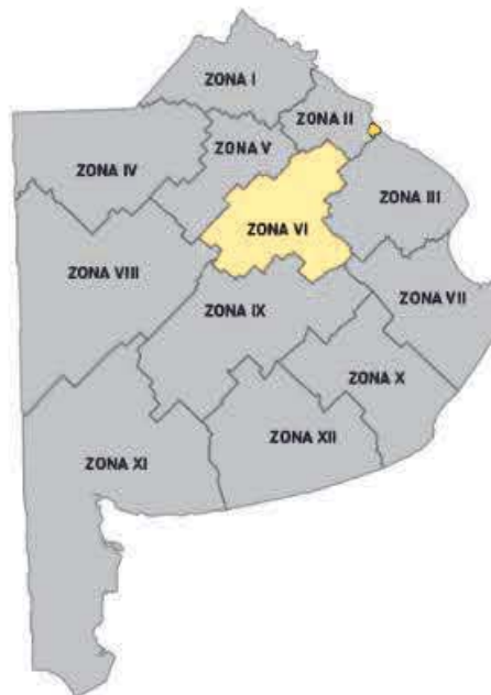
Imagen 1. División de Zonas Viales de la Provincia de Buenos Aires

En las siguientes imágenes se muestra la Zona VI sobre la Provincia de Buenos Aires, la cual será el área a intervenir: