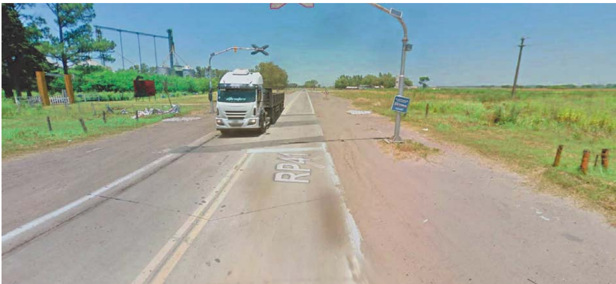
Imagen 4. Deterioro en la R.P. N°41. Partido de Navarro

El presente pliego contempla la ejecución de reconstrucción de losas en la totalidad de Zona Vial VI, manteniendo las características geométricas de las mismas.